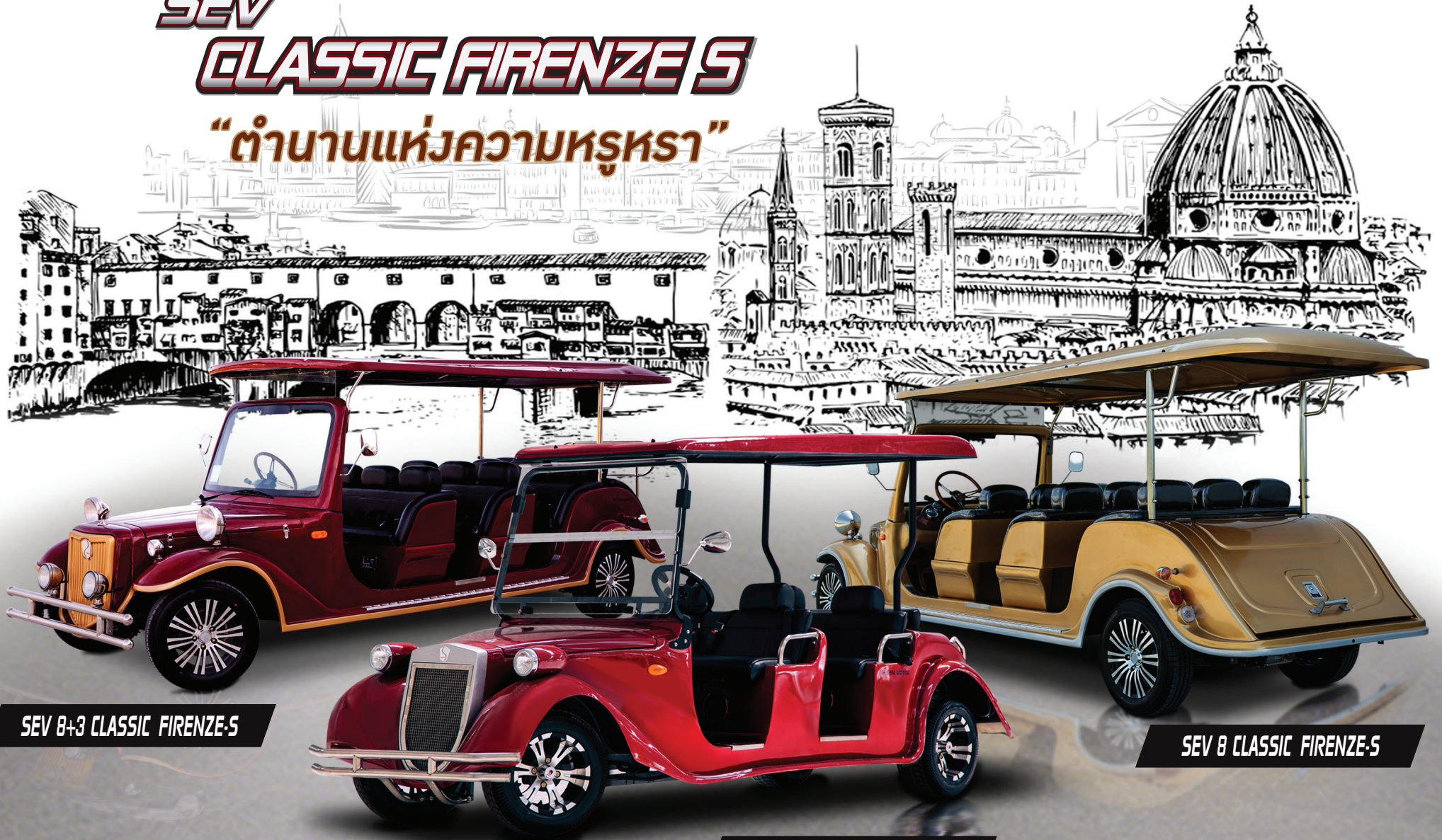
SEV 8+3 CLASSIC FIRENZE-S