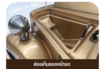
ช่องเก็บของหน้ารถ