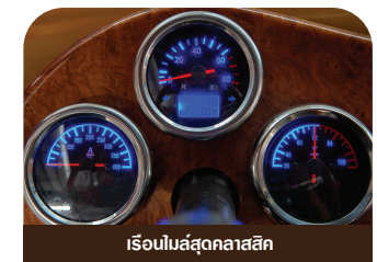
เรือนไมล์สุดคลาสสิก