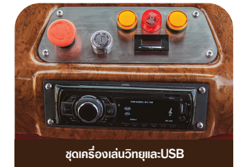
ชุดเครื่องเล่นวิทยุและ-USB

ที่อยู่: 9 หมู่ 3 ตำบลตานิม อำเภอบางปะหัน จังหวัดพระนครศรีอยุธยา 13220