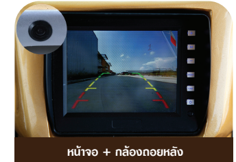
หน้าจอ + กล้องถอยหลัง